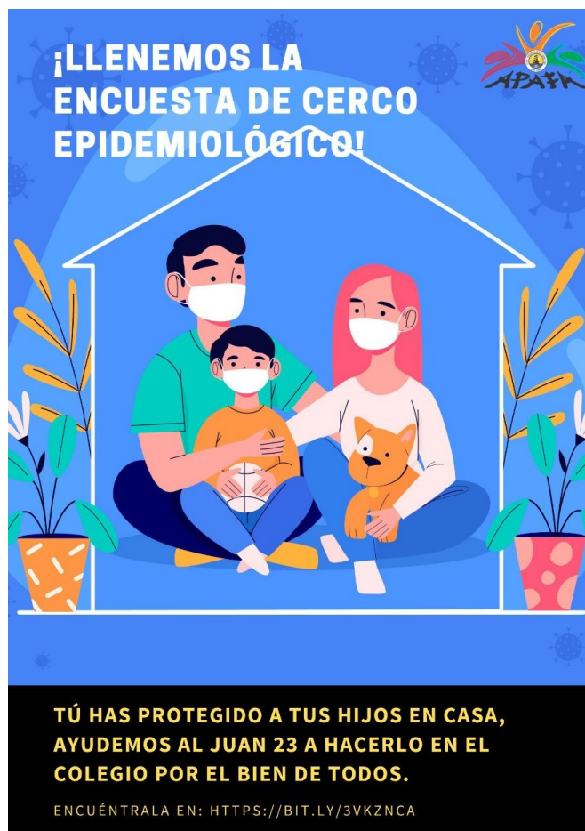
Pieza gráfica elaborada por APAFA